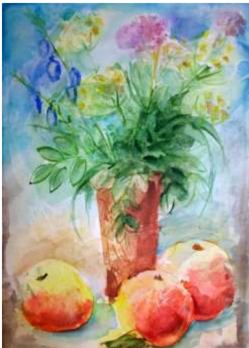
Эффект пищевой пленки