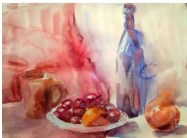
Работа акварелью «по-мокрому»