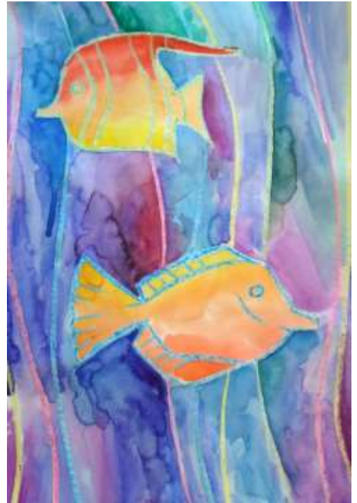
Акварель + пастель