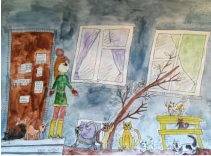
Акварель + гелевая ручка